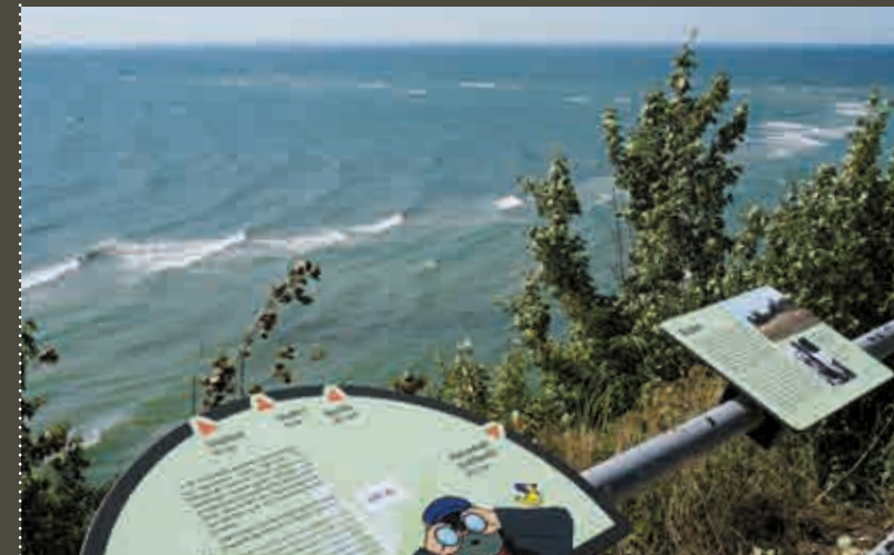
Kleiner Königsstuhl: Lassen Sie Ihren Blick weit über den Greifswalder Bodden schweifen!