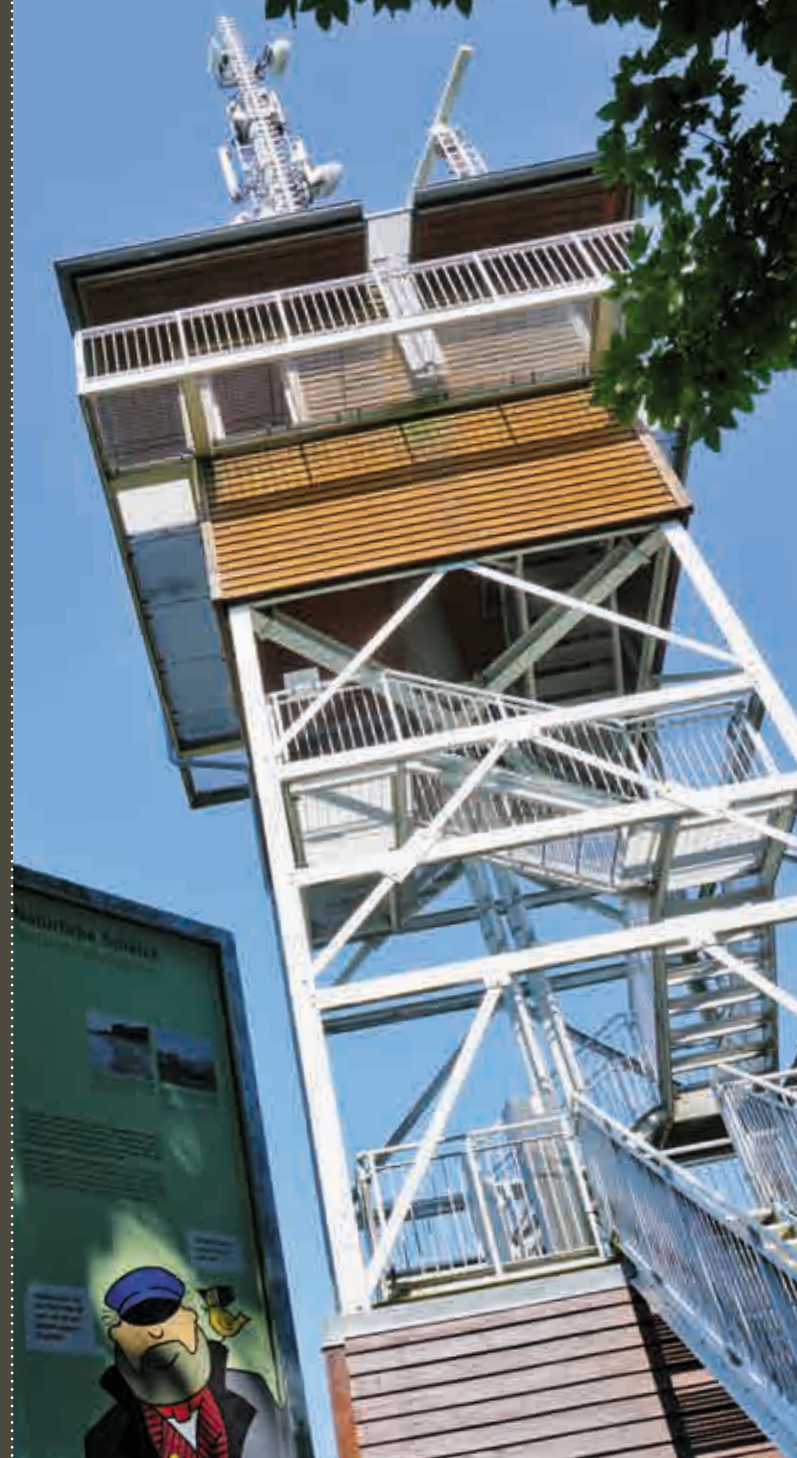
Wegweiser: Vom heutigen „Lotsenturm“ hat man noch immer den besten Ausblick über ganz Mönchgut.

Unser Naturpfad mit seinen zehn Erlebnisstationen ist insgesamt etwa sieben Kilometer lang. Sie lernen einzigartige Lebensräume kennen und tauchen ein in die von Lotsen und Fischern geprägte Geschichte Thiessows. Fischer Thies und seine Vogelfreundin Twitsy begleiten Sie. Starten Sie von einem der Ausgangspunkte und wählen Sie Ihren Weg. Unser Flyer beschreibt Ihnen kurz die einzelnen Stationen. Außerdem können Sie hier Ihr Wissen testen.