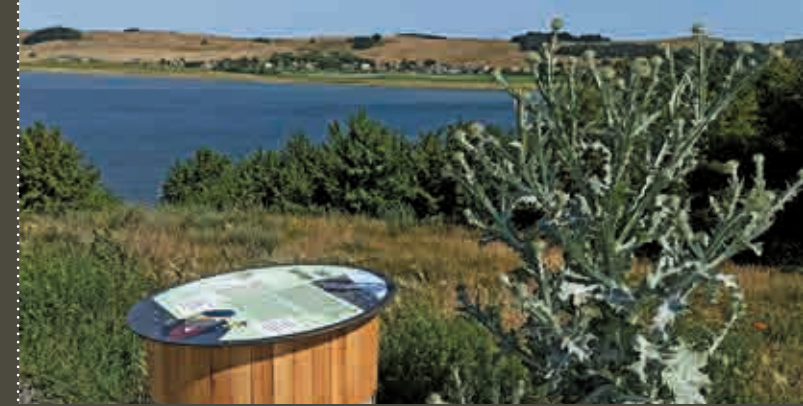
Zeitsprünge: Die Halbinsel Klein-Zicker hat eine spannende Geschichte hinter sich.

Ein Teil des Thiessower Hafens ist für die einheimischen Fischer reserviert. Spielerisch erfährt man hier so manches über Salzwasser- und Süßwasserfische.