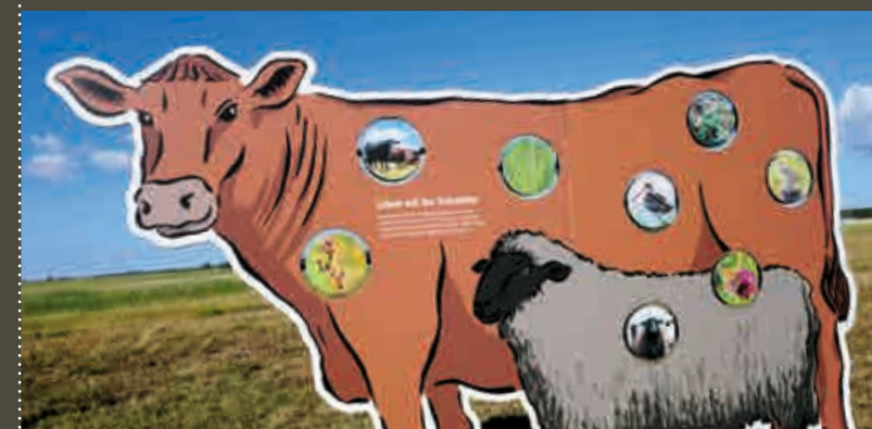
Salzwiese: An der Küste sorgen Rinder und Schafe für einen außergewöhnlichen Lebensraum.